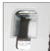
pojemność zacisków 35mm 2