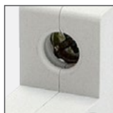
zaciski/šruby ze stali ocynkowanej