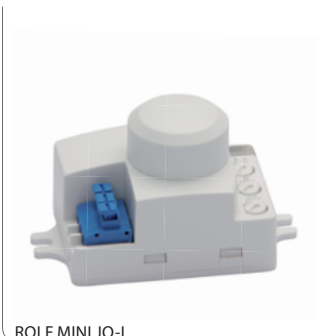
ROLF MINI JQ-L

Mikrofalowy czujnik ruchu / Microwave movement sensor