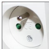
gniazdo typ E