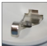
podłączenie przewodu PE od góry (GS16, FS16)