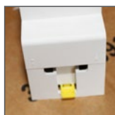
podłączenie przewodów L, N od dołu (GS16, FS16)