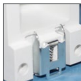
do montażu na szynie TH35