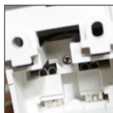
widok tyłu gniazda FS16