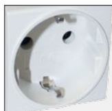
gniazdo typ F (Schuko)